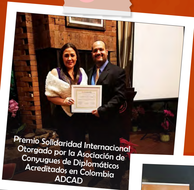
Premio Solidaridad Internacional Otorgado por la Asociación de Conyugues de Diplomáticos Acreditados en Colombia ADCAD