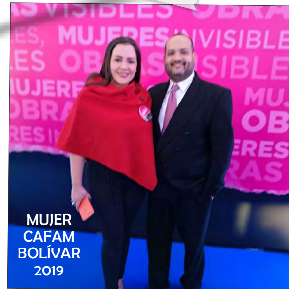
MUJER CAFAM BOLÍVAR 2019