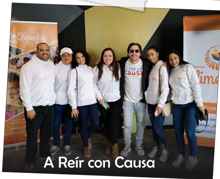
A Reír con Causa