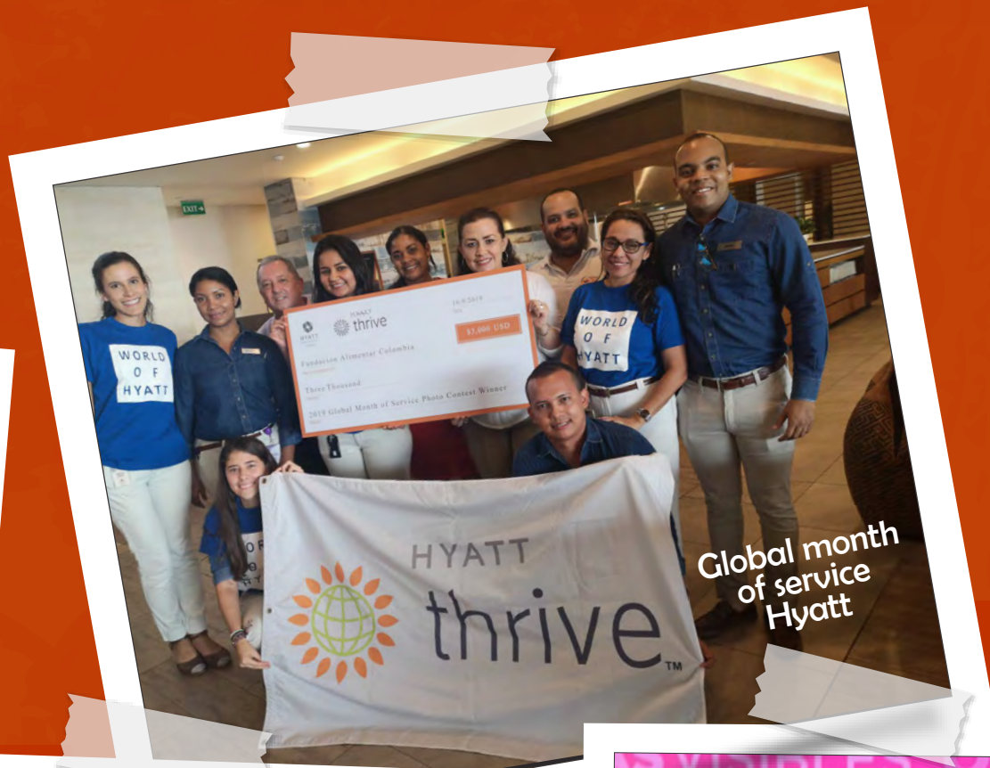
Global month of service Hyatt